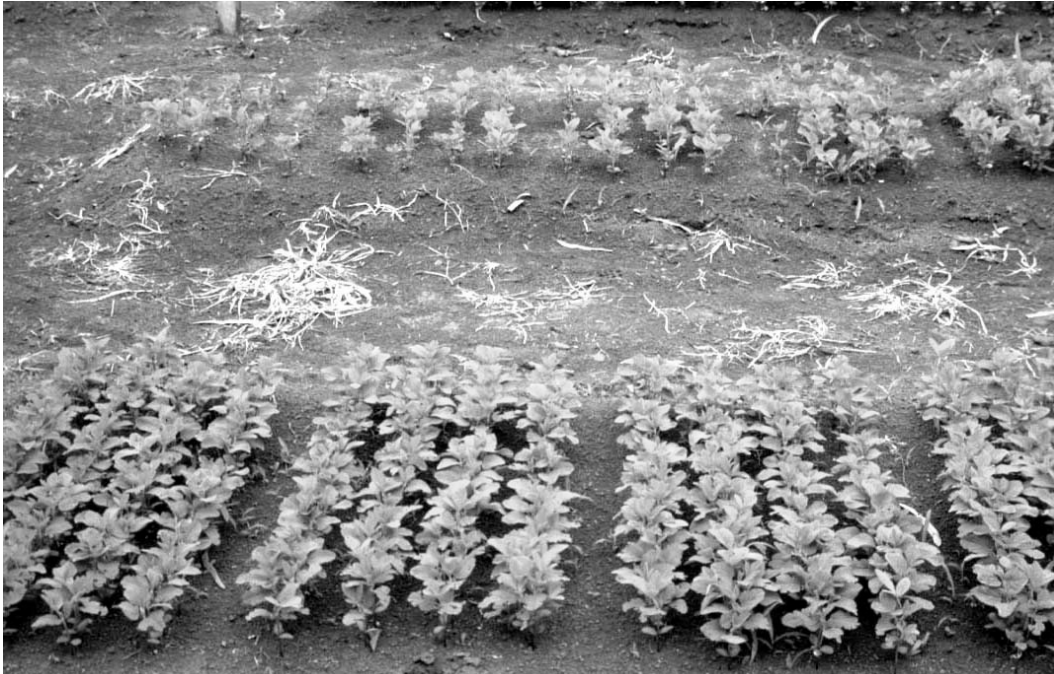
FIGURA 1. Canteiros de controle de qualidade de lotes de semente em uma empresa de Mato Grosso. Os mesmos lotes de sementes: na frente com o tratamento e ao fundo sem o tratamento com fungicida.

A eficiência de diversos fungicidas e/ou misturas desses, no controle dos principais patógenos da soja: Cercospora kikuchii , Cercospora sojina , Fusarium semitectum , Phomopsis spp. (anamorfo de Diaporthe spp.) e Colletotrichum truncatum , é anualmente avaliada na Embrapa Soja. O controle dos quatro primeiros patógenos é propiciado pelos fungicidas sistêmicos, especialmente do grupo dos benzimidazóis. Dentre os produtos testados e hoje recomendados para o tratamento de sementes de soja, os fungicidas thiabendazole, carbendazim e tiofanato metílico, têm sido os mais eficientes. Os fungicidas de contato, tradicionalmente conhecidos (captan, thiram e tolylfluand), que apresentam bom desempenho no campo quanto à emergência, não controlam, totalmente, Phomopsis spp. e Fusarium semitectum nas sementes, quando estas apresentam índices elevados daqueles patógenos (> 40%). Por essa razão, tais produtos devem sempre ser utilizados em misturas com um dos fungicidas sistêmicos (Tabela 2).