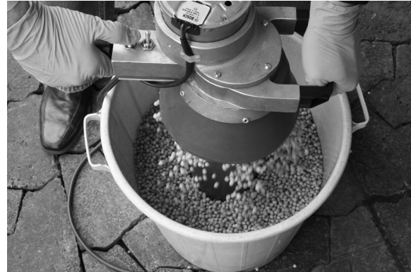
FIGURAS 4 e 5. Máquinas de tratar sementes diretamente na caixa da semeadora.